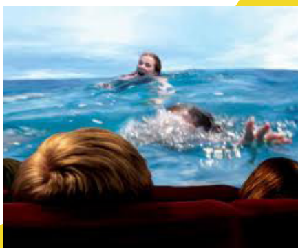
Trompe l'œil - 2012

• J.Henric, Les chorégraphies du mal. Bachelot Caron, Crimes et délices, Ed. Panama Musées, 2008.